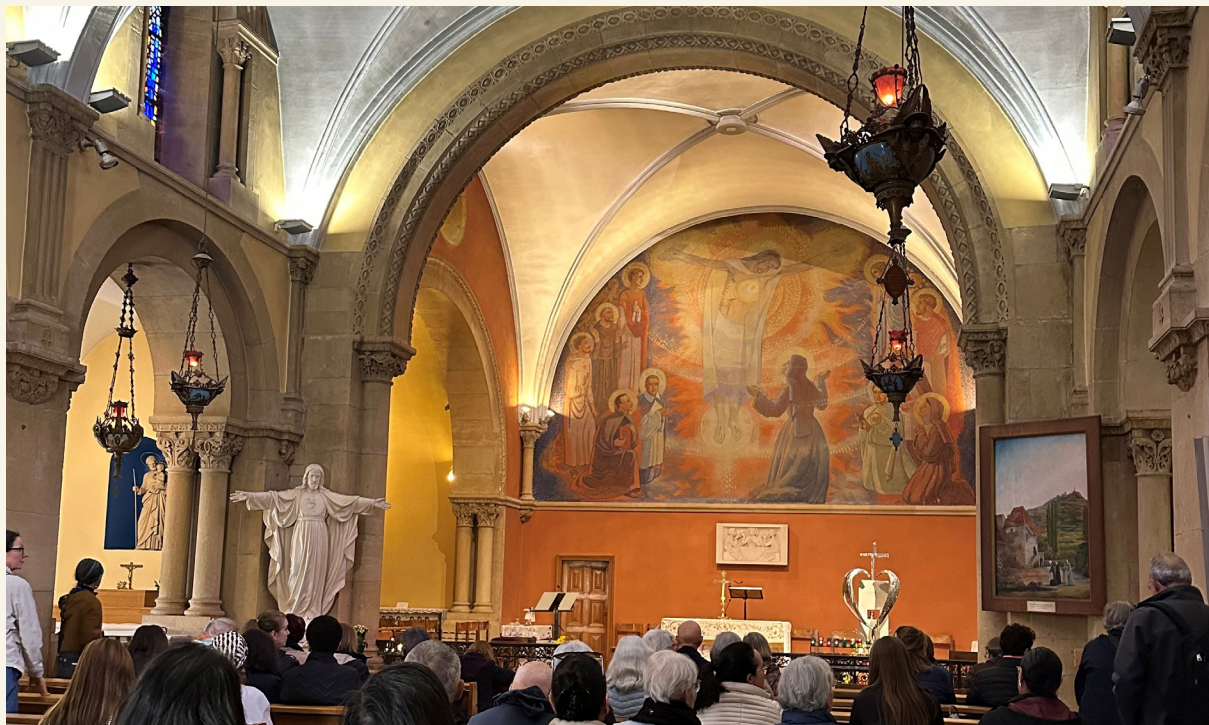
Bên trong Nhà Nguyễn Các Thị Kiến ở Paray-le-Monial, Pháp - nơi Chúa Giêsu hiện ra lần đầu tiên với Thánh Margaret Mary vào tháng 12, 1673.

tuôn chảy ân sủng mà chỉ nó mới có thể chữa lành những gì tội lỗi đã làm biến dạng. Trong Đức Kitô, Thiên Chúa không chỉ kêu gọi chúng ta hoán cải; Ngài còn ban cho chúng ta một trái tim mới.