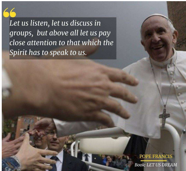
POPE FRANCIS Book: LET US DREAM

Let us listen, let us discuss in groups, but above all let us pay close attention to that which the Spirit has to speak to us.